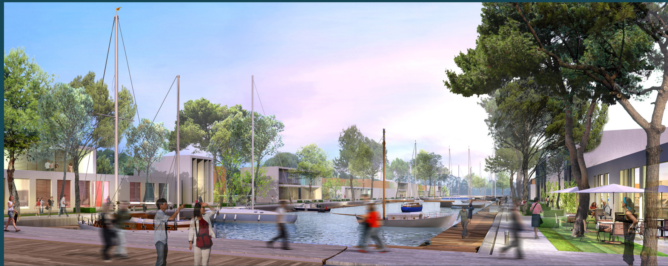
03 VISTA SULLE PENISOLE EDIFICATE