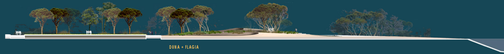
DUNA + FLAGIA