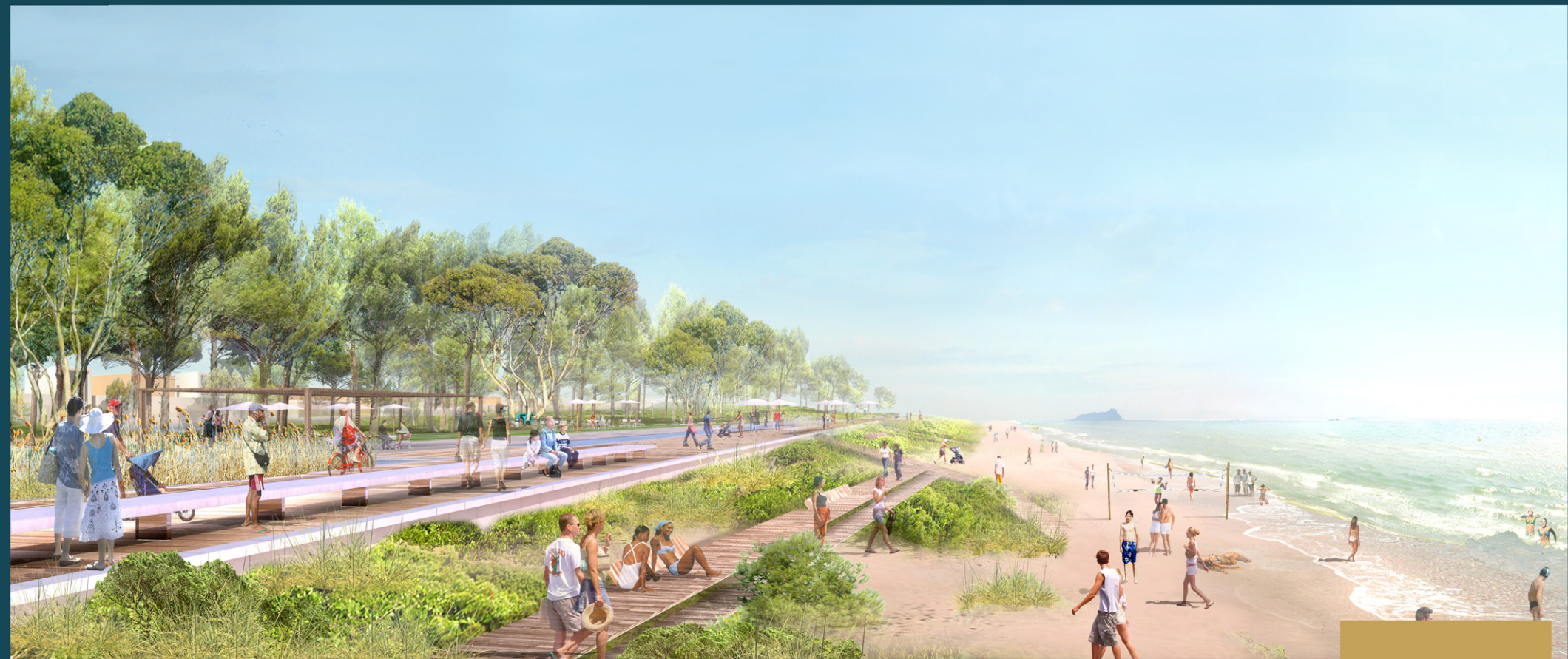
04 IL LUNGOMARE