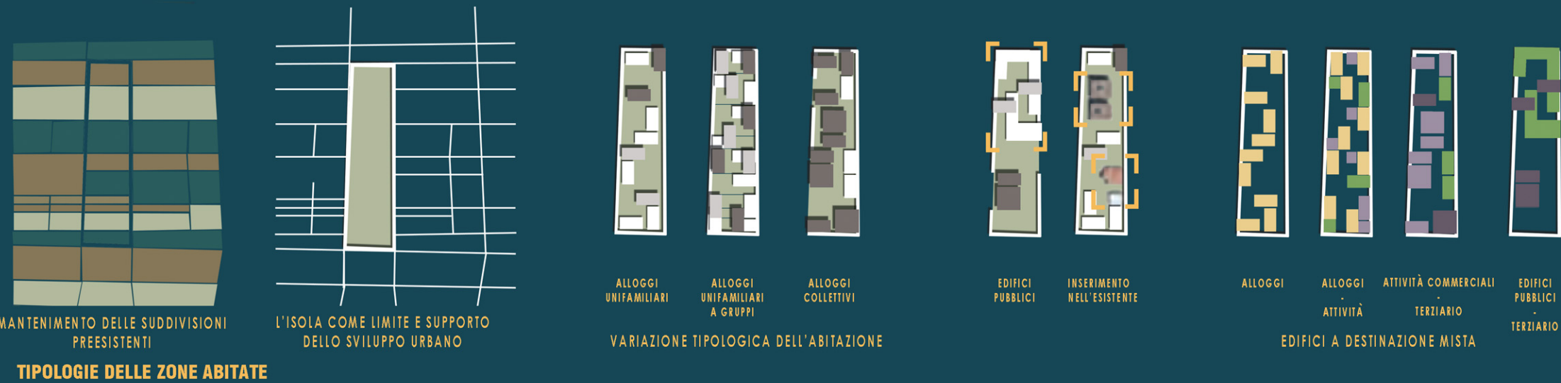
TIPOLOGIE DELLE ZONE ABITATE