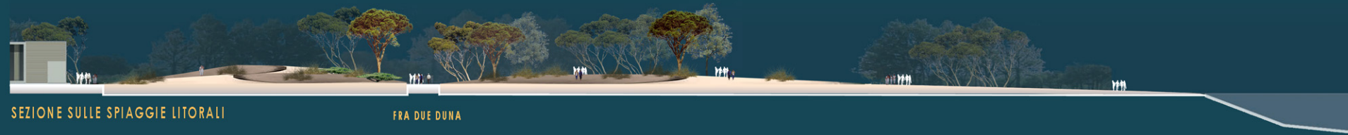
SEZIONE SULLE SPIAGGIE LITORALI FRA DUE DUNA